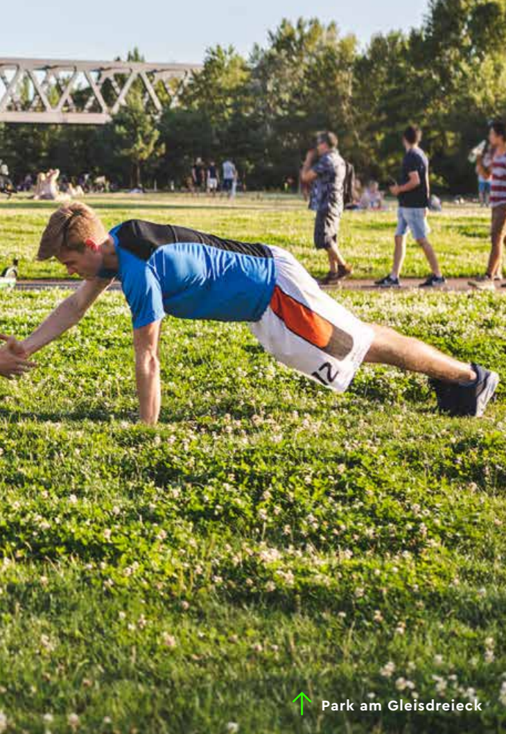
↑ Park am Gleisdreieck

s Unternehmen tungsfähiger nachhaltige ng in Berlin.