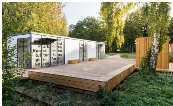
Info-Pavillon im Spreepark