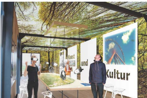
Visualisierung Info-Point

Die Ausstellung zeigt, wie ein spannender Dialog zwischen der bewegten Vergangenheit des ehemaligen Vergnügungsparks und heutigen Formen und Medien der Kunst hergestellt werden könnte. Die noch vorhandenen Gebäude und ehemaligen Fahrgeschäfte sollen nicht wieder in ihrer ursprünglichen Form genutzt werden, sondern könnten Raum bieten für Installationen und Skulpturen, für Interventionen, Performances und Veranstaltungen. So soll ein durch Künstler gestalteter Ort für künstlerische und kulturelle Nutzungen entstehen. Gleichzeitig ermöglicht das Konzept den Erhalt der schützenswerten Natur im Spreepark. Eine behutsame Weiterentwicklung, die den Charakter des Ortes als ehemaligen Freizeitpark einfängt, gewährleistet eine sensible Integration in das Landschaftsschutzgebiet Plänterwald.